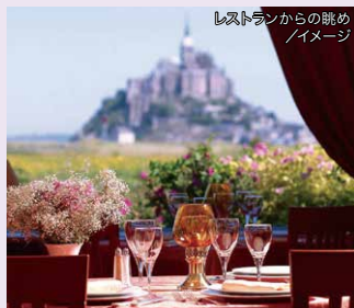
レストランからの眺めイメージ