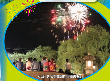
イメージ写真提供 豊岡市役所