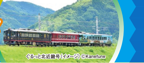
ぐるっと北近畿号(イメージ)

出発日:7月25日(火) 出発限定 大阪(新) コースコード:4070048-□ | 101:2名以上1室 102:1名1室 販売店の方へ ※予約画面→単一コース照会 ※往復乗車駅必須選択 ※宿泊必須選択