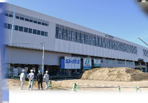
ロワジュールホテル上越(高田駅前)