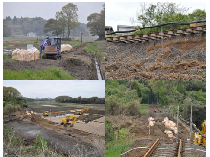
ひたちなか海浜鉄道 金上—中根間 2011年5月1日撮影