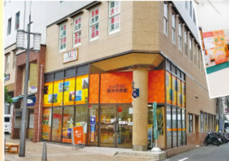
店内・外観は写真提供: 愛媛県観光物産協会