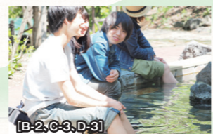
[B-2, C-3, D-3]

温泉街には無料で定山溪自慢の源泉を楽しむ手湯と足湯があります。3か所の足湯をめぐりながら温泉街をそぞろ歩きましょう?夜には湯の町にイルミネーションが灯ります。