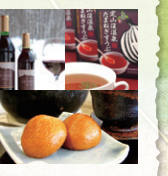
ノースサザリ サッポロ

おみやげの定番「温泉まんじゅう」は、店それぞれに味の個性があり食べ比べも楽しい。食の世界遺産「札幌黄たまねぎ」から生まれた定山溪だけの味「定山溪温泉たまねぎすずぶ」は格別の美味しさ。八剣山の麓で栽培、醸造されたワインなど、定山溪ならではの「味」をおみやげにいかがでしょう。